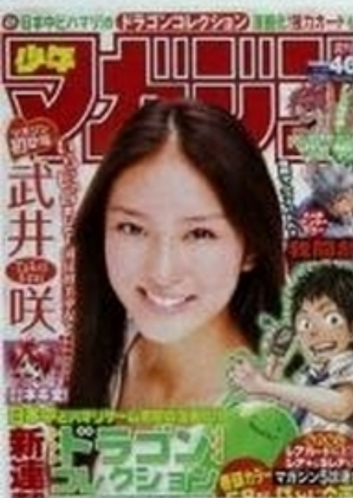
「週刊少年マガジン」 2011年9月14日号 (講談社) 漫画雑誌の表紙を満面の笑みで飾った。グラビアは赤と紺のボーダーワンピース