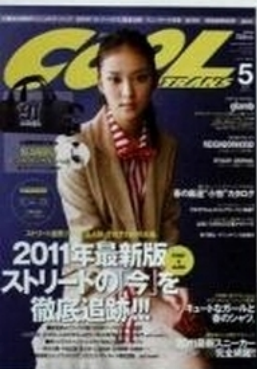
「COOL TRANS」 2011年5月号 (ワニブックス) ストリートファッション雑誌の表紙では見慣れないジャケット姿が新鮮だった

グループアイドル系が席巻する昨今の雑誌の表紙。そのなかでこれだけ多くのジャンルの表紙を飾る咲くは、スゴイ。さらに、「創刊30周年記念号」や「夏の特号」など、各雑誌の記念号で表紙を務めていることが多いのも彼女の勢いを物語っている。