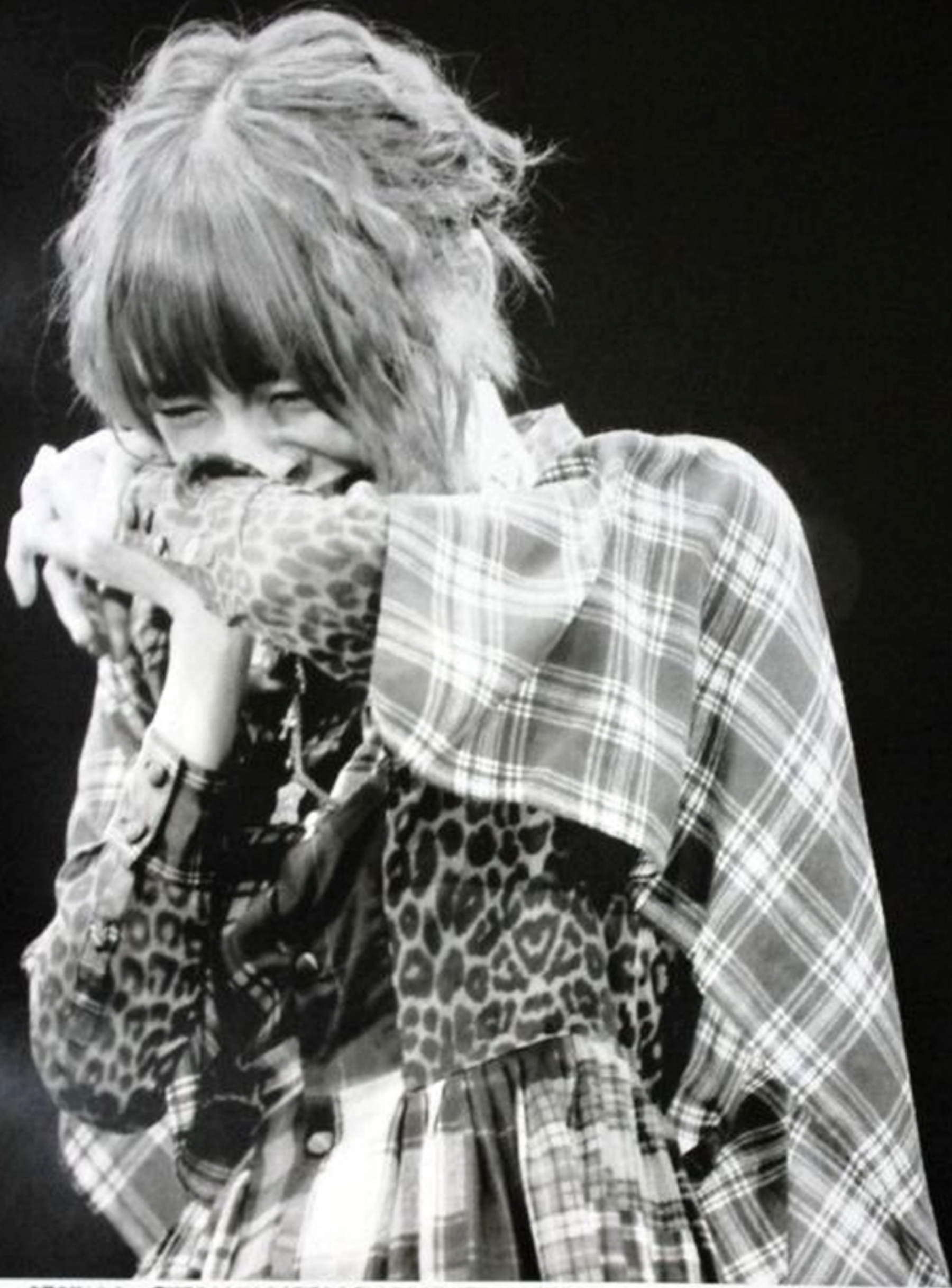
志願の初センター。喜びでこんなに大きく表情をくずした彼女を誰が想像できたろうか

これまでセンターへの願望を主張したことは一度もない。中心メンバーの一人でありながら、いつも少し後ろの位置でほかのメンバーを支えつつづけてきた。