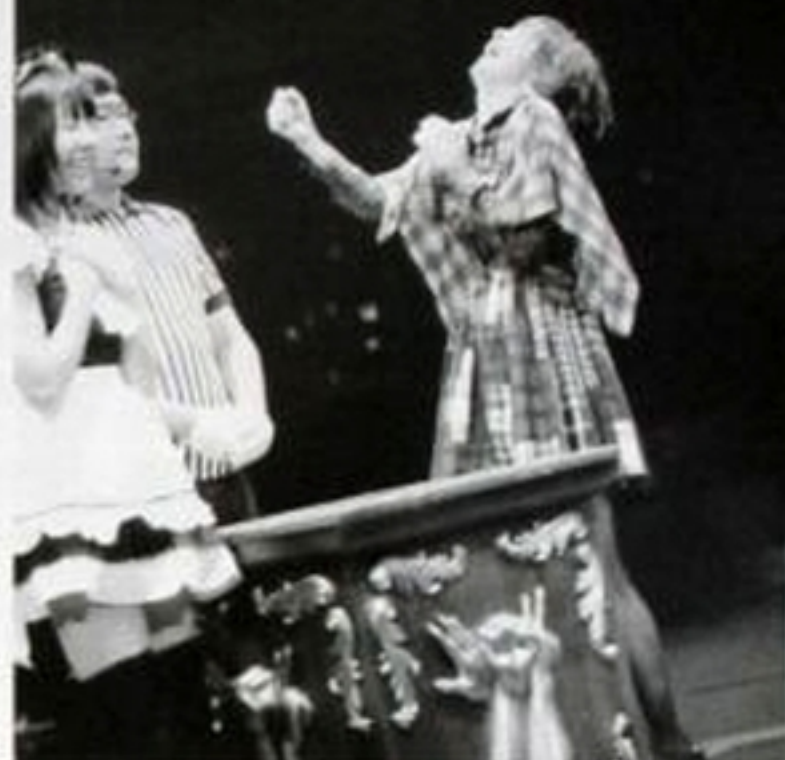
初センターが確定した瞬間。その胸の内に秘めていた熱い思いが、ついに現れた！

決勝戦はあいこが3回連続するという権威に、4回に出した試合のグーで勝負は決まった。