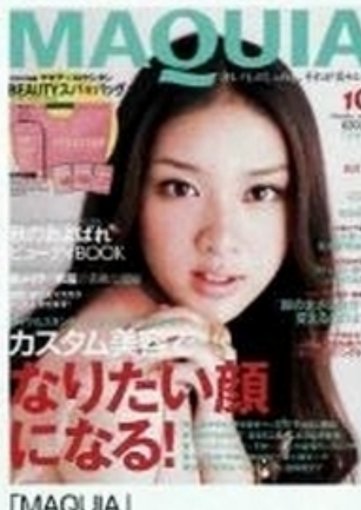
「MAQUIA」 2011年10月号 (集英社) 大人向け美容雑誌にいつもよりちょっとだけ落ち着いたメイクと衣装で初登場