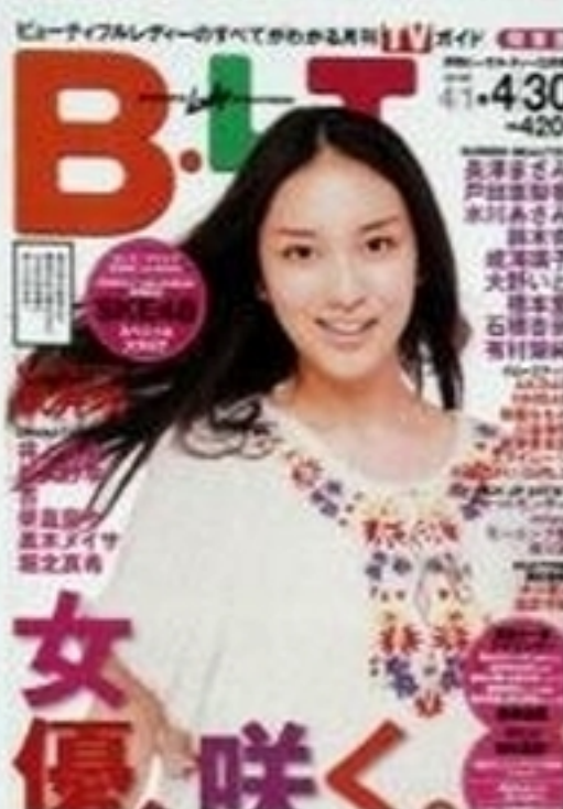
「B.L.T.」2011年5月号 (東京ニュース通信社) テレビ誌では巨匠・篠山紀信氏の撮影で表紙と巻頭グラビア5ページを飾った