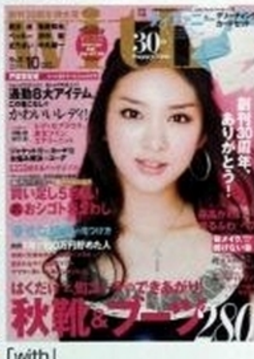
「with」 2011年10月号 (講談社) 女性ファッション誌の創刊30周年記念で本誌と別冊の表紙を飾る快挙を成した